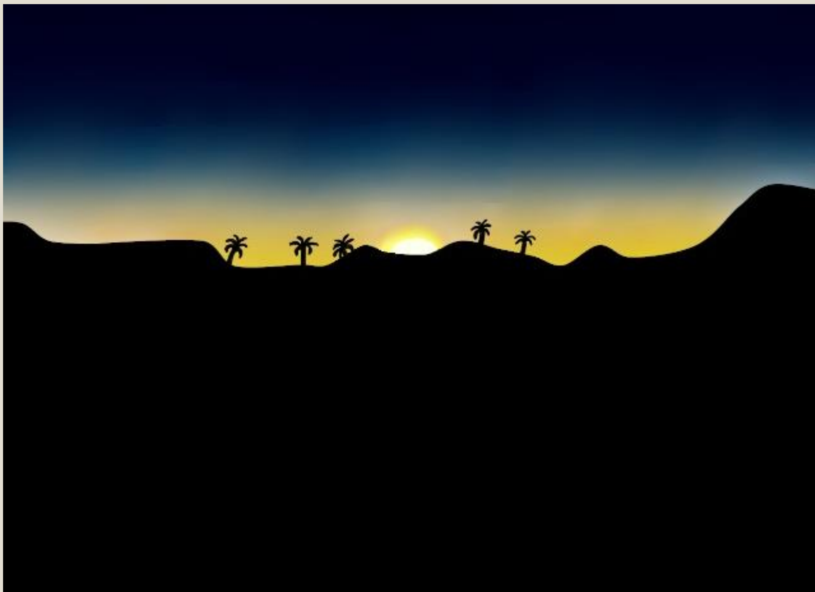
Ilustração da vista mais observada na Quarentena