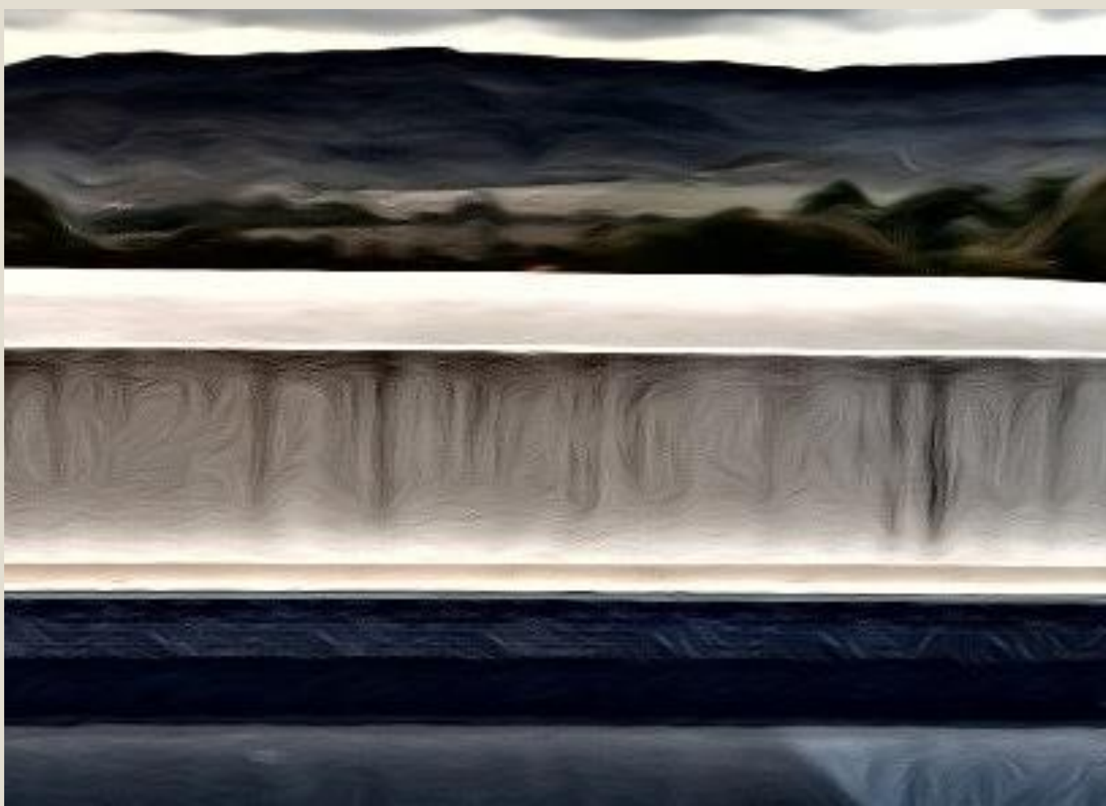
Ilustração da vista mais observada na Quarentena